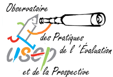
Tableau de Bord 2018 - 2019