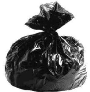
Un sac plastique