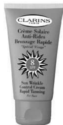
Une crème solaire