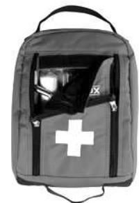
une trousse de secours