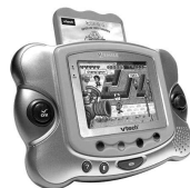
Un jeux vidéo