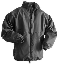
un vêtement de pluie