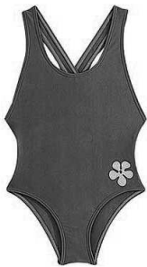
un maillot de bain