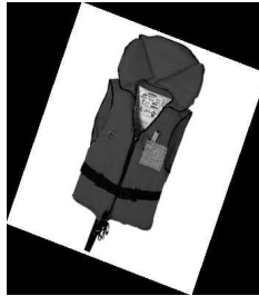
un gilet de sauvetage