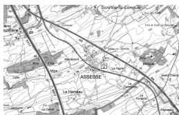
Une carte pour l'itinéraire