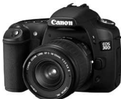
Un appareil photo