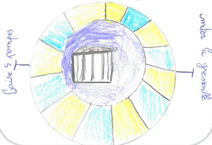
Ton défi en images

Envoie ton défi à : defirecre@laligue-usep.org