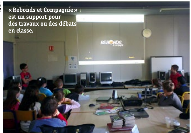
« Rebonds et Compagnie » est un support pour des travaux ou des débats en classe.

sion précédente. Ce travail amènera aussi les enfants à questionner les comportements de chacun.